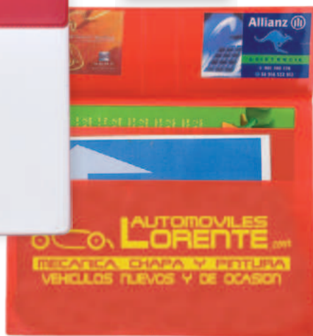
206 CARPETA DOCUMENTACIÓN VEHÍCULOS PVC opaco y transparente Con 2 bolsillos, tarjetero y portacarnet 25 x 18.5 cms A

COLORES DISPONIBLES DEL PVC EN LA PÁGINA 60